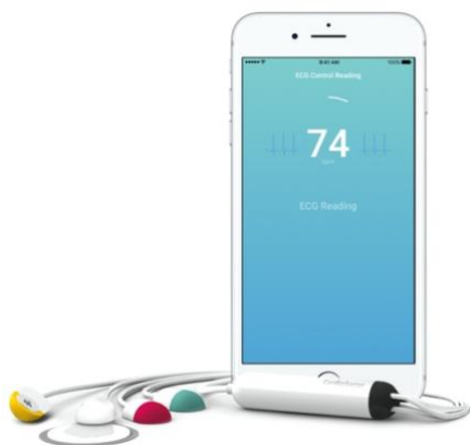
CardioSecur Active zeichnet valide EKG Daten auf und gibt eine

Weitere Informationen unter www.cardiosecur.com